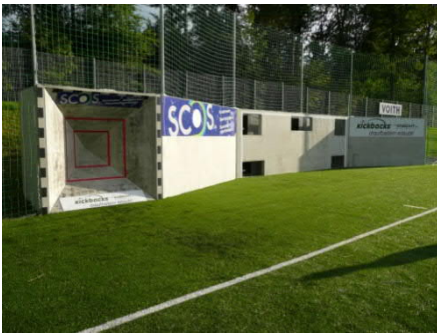
(beim 1.FC Heidenheim)

Die Wände sind stabil und witterungsbeständig. Zudem sind die Flächen auch bestens für Sponsoren geeignet.