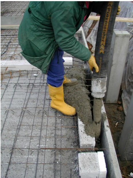
Verguss mit Ortbeton

Klassische Anwendungsgebiete der KNECHT Hohlwand im Geschöß- und Kellerbau, in Kombination mit anderen Wandtypen, z. B. der KNECHT-Massivwand.