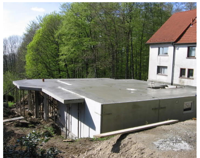
Mit Ortbeton auf die Gesamtdicke der Decke aufbetoniert.