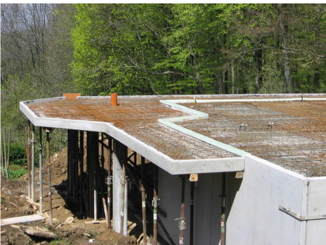
Deckenelemente sowie auskragende Bauteile mit oberer Bewehrung.